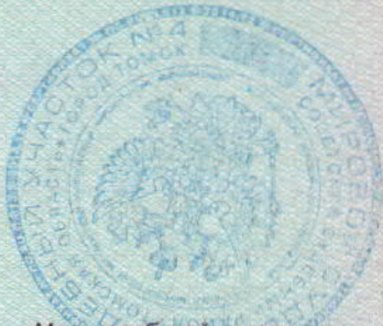
Место гербовой печати суда (мирового судьи) (М.П.)

для организации - наименование, местонахождение, указанное в учредительных документах, фактический адрес (если он известен), дата государственной регистрации в качестве юридического лица, идентификационный номер налогоплательщика; для Российской Федерации, субъекта Российской Федерации или муниципального образования - наименование и адрес органа, уполномоченного от их имени осуществлять права и исполнять обязанности в исполнительном производстве)